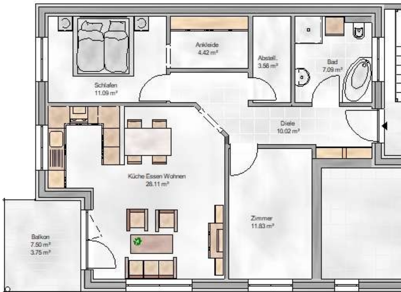
Grundriss Wohnung Frankfurt-Le

Grundstücksfläche: 860,00 m 2 Kaufpreis: Kauf Kaufpreis: 1.500.000,00 EUR